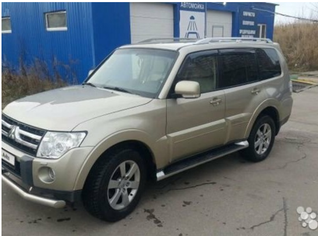
Фотография от 26 ноября 2019

VIN: JMBLYV98W8J501508 Цвет: Бежевый Год выпуска: 2008 Объем двигателя: 3 200 см³ Тип ТС: Легковой прочий Мощность: 165 л.с.