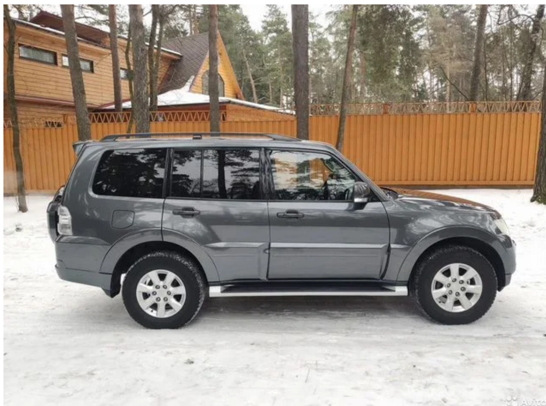
Фотография от 3 марта 2021