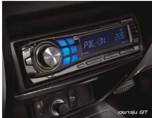
เฉพาะรุ่น GT

เครื่องเล่นวิทยุ CD/MP3 พร้อมช่องเสียบ USB สำหรับอุปกรณ์ต่อพ่วง