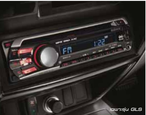
เฉพาะรุ่น GLS

เครื่องเล่นวิทยุ CD/MP3 พร้อมช่องเสียบ USB สำหรับอุปกรณ์ต่อพ่วง