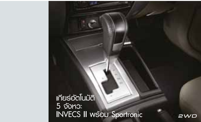
เกียร์อัตโนมัติ 5 จังหวะ INVECS II พร้อม Sportronic

ให้ทุกการเดินทางเป็นไปอย่างสะดวกสบายสูงสุด ไม่ว่าจะใช้งานในสัปดาห์ที่ต้องบรรทุกสัมภาระขนาดใหญ่หรือผู้โดยสาร เพราะมีห้องโดยสารที่กว้างขวาง พร้อมเบาะคนขับสามารถปรับระดับสูงต่ำได้ จึงรองรับสรีระได้อย่างลงตัว ภายในห้องโดยสารได้รับการตกแต่งให้สัมผัสถึงความหรู กว้างสบาย พร้อมระบบปรับอากาศที่ให้ความเย็นสบายตลอดการเดินทาง