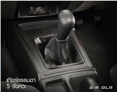
เกียร์ธรรมดา 5 จังหวะ