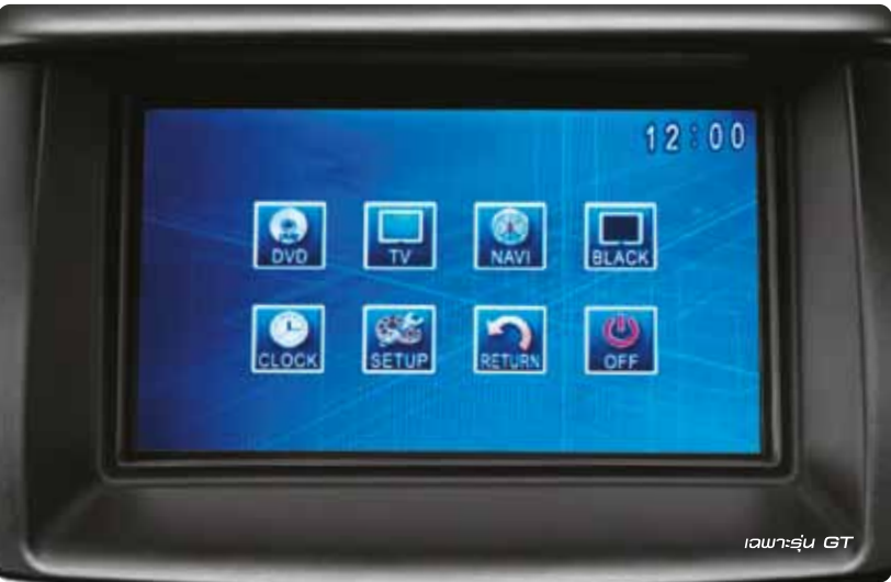
จอภาพแบบ WIDE SCREEN ขนาด 7 นิ้ว พร้อมระบบ Touch Screen แบบ IMT (Intelligent Magic Touch)

*ระบบรับสัญญาณ TV และระบบ NAVIGATION เป็นอุปกรณ์ติดตั้งเพิ่มเติม