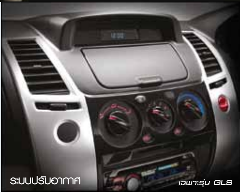
ระบบปรับอากาศ